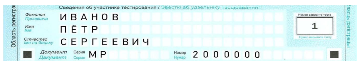
Рис. 2. Образец заполнения области регистрации

Если при заполнении области регистрации бланка ответов допущена ошибка, неверную информацию следует зачеркнуть, а правильные данные записать в том же поле справа, отступив на одну клетку.